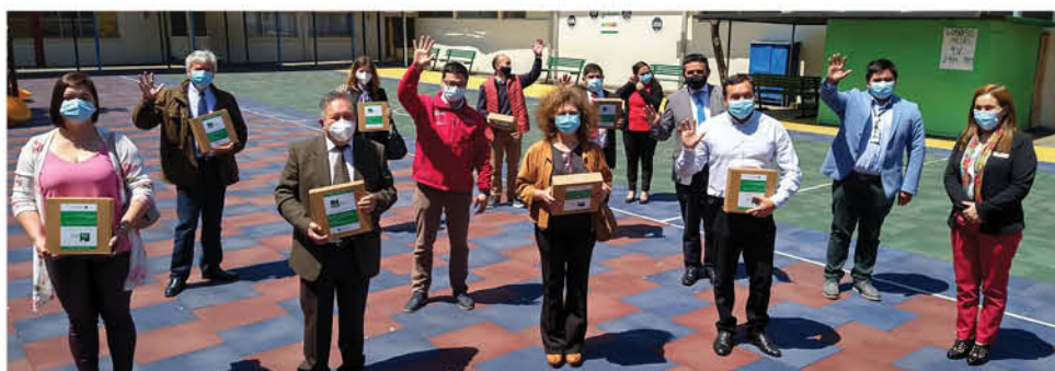
EL MINEDUC busca llevar el acceso a la tecnología en los establecimientos más vulnerables y alejados de ésta.

El material C3 Classroom que se distribuye a los establecimientos educacionales seleccionados incluye 14 contenidos pre-cargados, entre los que se encuentran Aprendo en Línea Estudiantes, Aprendo en Línea Docentes, Cursos Moodle, Educar-Chile y educaLAB.