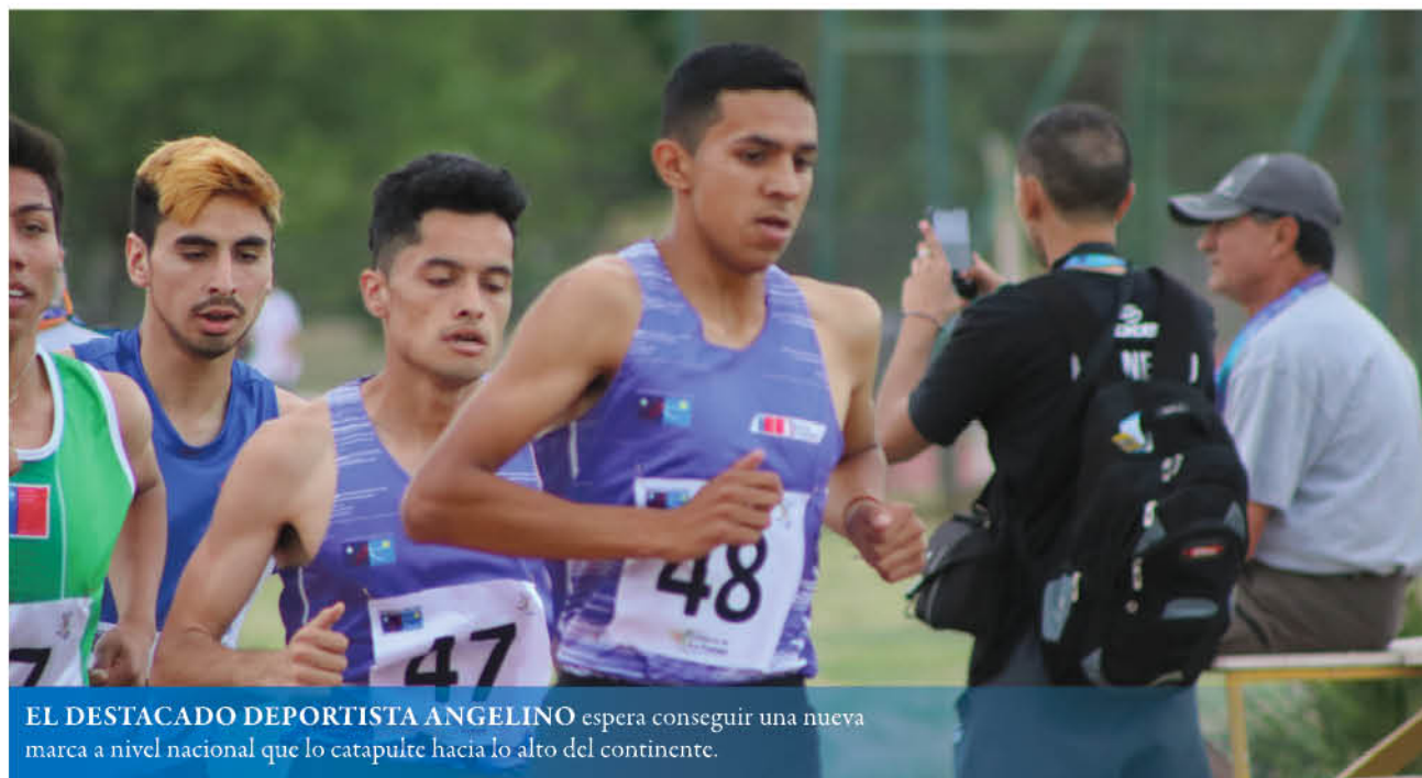
EL DESTACADO DEPORTISTA ANGELINO espera conseguir una nueva marca a nivel nacional que lo catapulte hacia lo alto del continente.