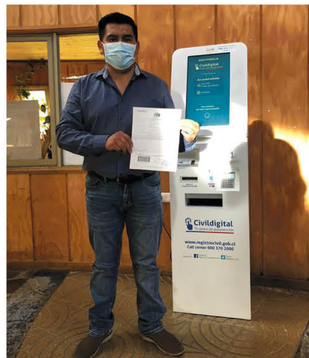
EL TÓTEM PERMITIRÁ obtener 28 certificados y la Clave Única.

La herramienta ha sido ubicada a la entrada de la casa consistorial y estará disponible para toda la comunidad entre las 8:30 y las 17:30 horas.