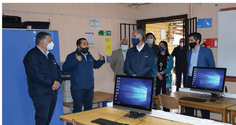
LA ESCUELA UBICADA en la avenida Sor Vicenta cuenta con una extensa red de internet que podrán usar alumnos y apoderados.

El Consejo Urbano de Los Ángeles fue el que llevó a cabo la iniciativa para que así los estudiantes y la comunidad tengan acceso al ciberespacio.