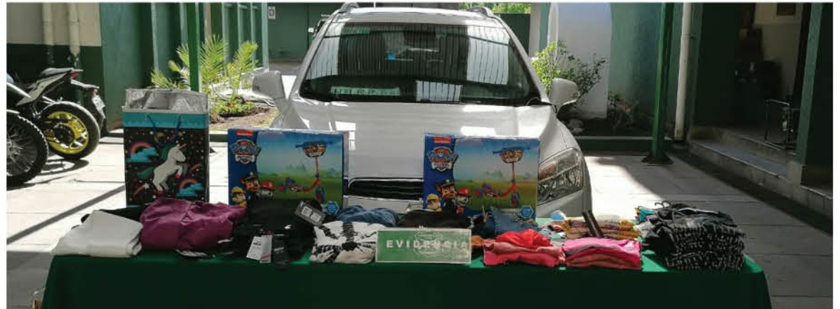
PARTE DE LAS ESPECIES RECUPERADAS por Carabineros que estarían en poder las mecheras penquistas. También se requisó un vehículo en el cual se desplazaban.

El trío habría recorrido las instalaciones de locales como Paris, Falabella, La Polar e Hites para sustraer diversas prendas de vestir: pantalones, poleras, camisas y blusas, todas las que guardaban en la “cartera biónica” para evitar que sonaran las alarmas. Se estima que el monto