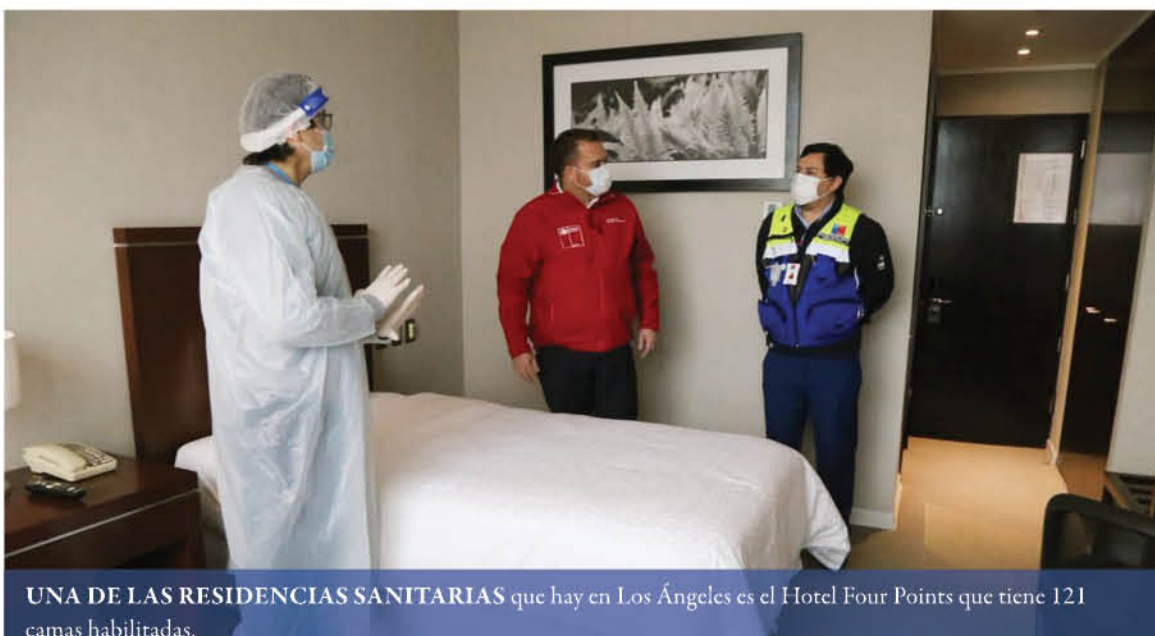
UNA DE LAS RESIDENCIAS SANITARIAS que hay en Los Ángeles es el Hotel Four Points que tiene 121 camas habilitadas.

Cabe destacar que a nivel provincial se informó de 5.959 ingresos se han registraron en Concepción lo que alcanzó un 78,44%, le sigue Biobío con un 15,40% representado 1.170 entradas a residencias sanitarias y, por último, 468 accesos en Arauco lo que da 6,16%.