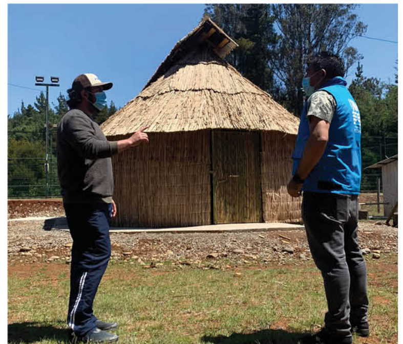
LA IDEA ES EDUCAR, pero también se busca hacer un circuito cultural para turistas quienes quieren aprender de la cultura Mapuche.

Por otro lado, el profesor a cargo de la escuela del sector,