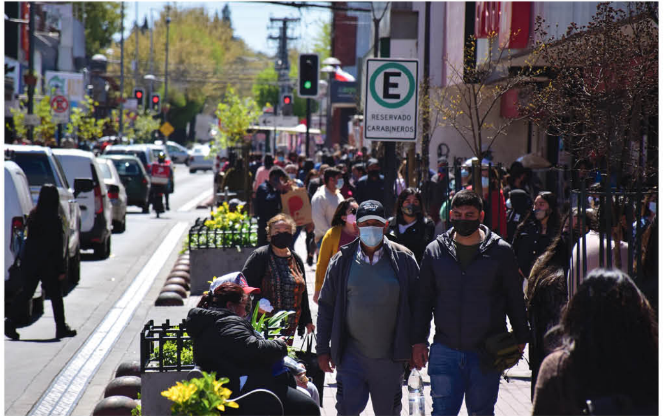
LAS AGLOMERACIONES DE PERSONAS en el centro de Los Ángeles son usadas por los venezolanos que viven de la mendicidad.

sensibles tiene que ver con los niños, a quienes se les estarían vulnerando sus derechos fundamentales de vivienda, educación, salud, alimentación y vestuario.