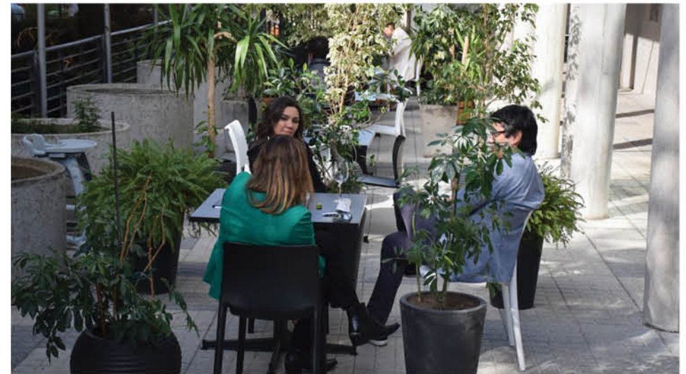
LOS LOCALES que podrán atender en su interior deberán cumplir con el protocolo sanitario indicado por la autoridad.

gastronómico, así como otros rubros que han sido fuertemente afectados y que están cerrado desde marzo a la fecha, considerando que no hay espacio y hay restaurantes que no tienen las condiciones para generar terrazas como algunos lo han ido implementando”.