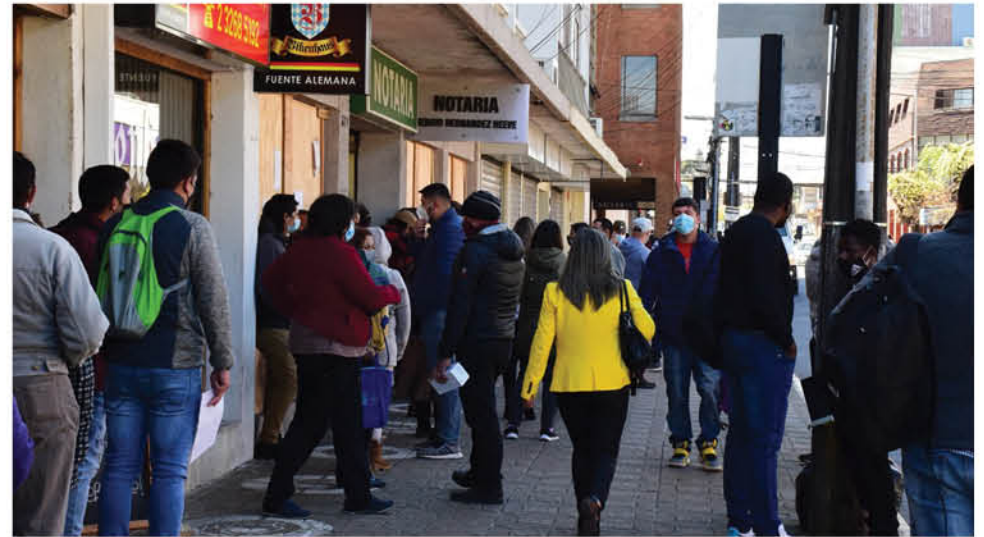
LA COMUNA DE LOS ÁNGELES presenta la mayor cantidad de activos, seguida de Concepción, con 152 y Coronel, con 101 casos.

El resto de las alzas corresponden a las comu-