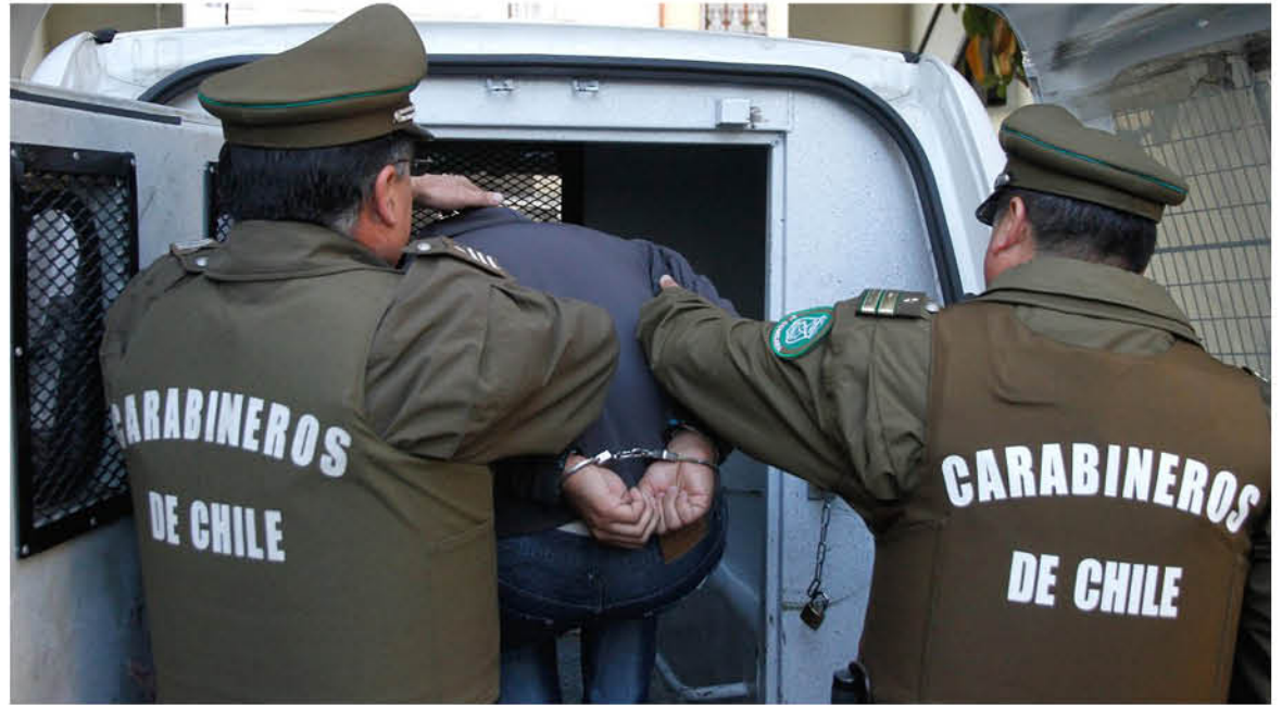
EL TRIBUNAL DECRETÓ tres meses de plazo para la investigación.

Mosqueira precisó que “la Fiscalía, atendida la gravedad de los hechos por los cuales fue formalizado el imputado, el número de delitos y la reiteración de éstos en el tiempo, más el bien jurídico protegido, que es la indemnidad sexual de los menores, solicitó la medida cautelar de prisión preventiva, ya que estimamos que la libertad del imputado constituye un peligro para la seguridad de la