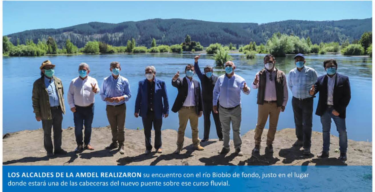
LOS ALCALDES DE LA AMDEL REALIZARON su encuentro con el río Biobío de fondo, justo en el lugar donde estará una de las cabeceras del nuevo puente sobre ese curso fluvial.

Por lo mismo, insistió en la urgencia que "el ministro de Obras Públicas