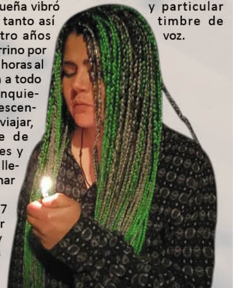
“PUNTO APARTE” es el single que está promocionando Camilumpen, creación en la que cuenta con el apoyo de otra voz femenina.

Si bien no es un género masivo, “Camilumpen” se levanta como una de las principales exponentes del freestyle en Biobío, al usar como carta de presentación al menos cuatro de sus últimas creaciones donde destacan sus rimas y particular timbre de voz.