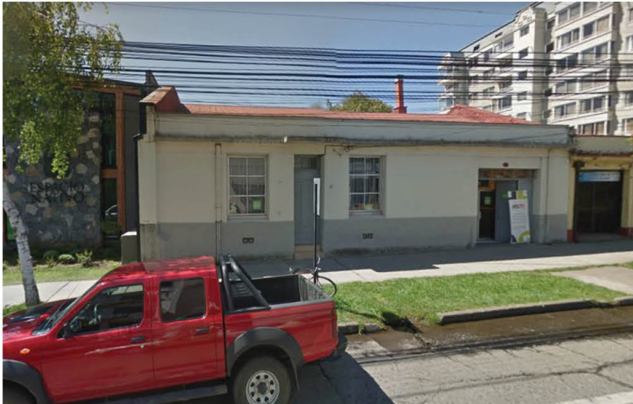
ROBERTO ESPINOZA se llama la biblioteca municipal en homenaje al destacado hombre público.