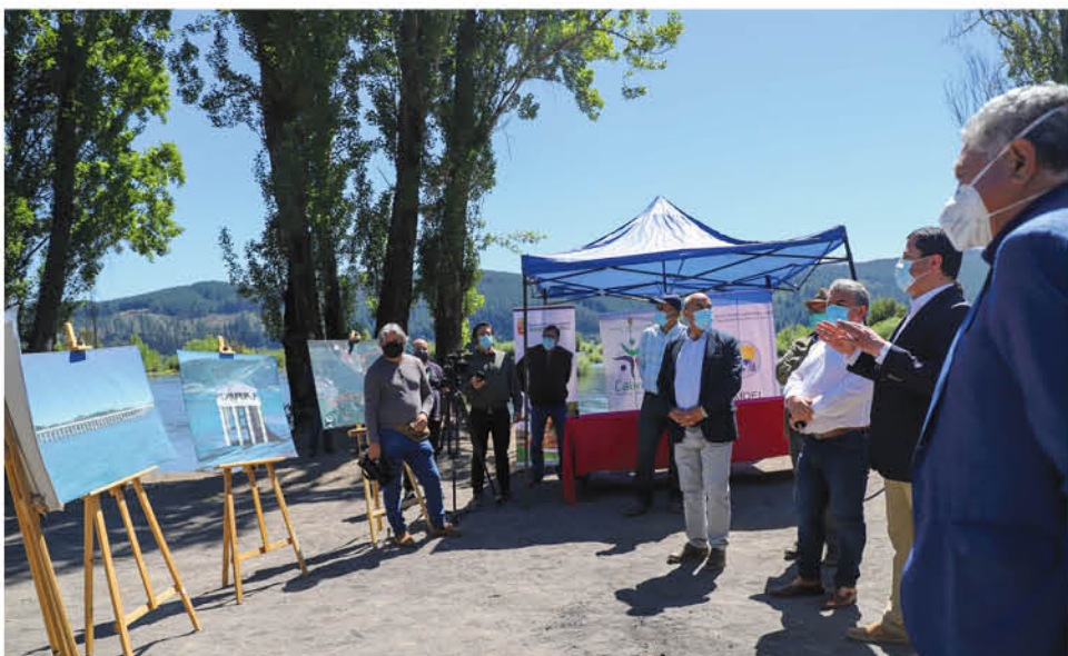
EL ALCALDE MARIO GIERKE encabezó la actividad realizada con sus pares de la Asociación de municipios.