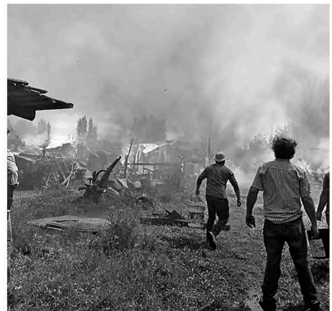
LAS LLAMAS CONSUMIERON la parte de la cocina de una vivienda en el sector Chacayal Norte a unos 20 kilómetros de Los Ángeles.

lugar, las unidades de emergencia se encontraron con un incendio declarado y que ya consumía la parte de una cocina de una casa habitación por lo que solo se pudo realizar labores de contención para luego remover los escombros.