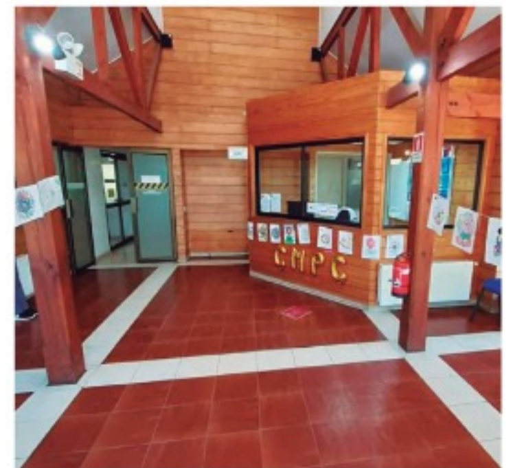
El recinto se inauguró el 4 de junio pasado con la posibilidad de habilitar hasta 116 camas completamente equipadas