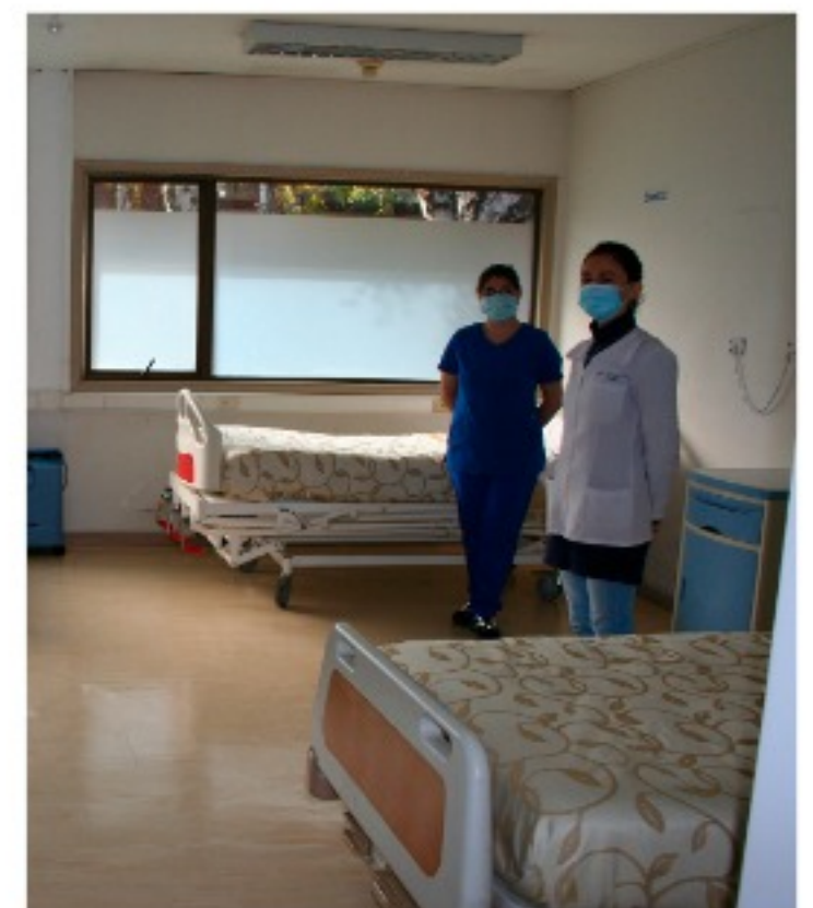
El primer ingreso se registró el 19 de junio.