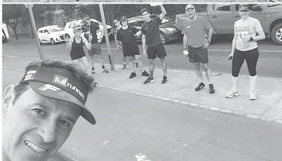
LOS DESTACADOS TRIATLETAS ANGELINOS esperan recuperar su ritmo deportivo para volver a figurar prontamente en las competencias nacionales.

Los Ángeles realizaron un llamado a la comunidad en el contexto de la creciente ola de accidentes automovilísticos donde ha fallecido un gran número de ciclistas a nivel país precisando que: “Es importante que los ciclistas usen todos los elementos de protección y distinción necesarios, el casco es primordial junto a ropa de colores que se pueda identificar a distancia, ropa negra no sirve y se pierde, tomando en cuenta la velocidad de los vehículos. La indumentaria es muy importante es algo que exigimos nosotros. Es importante también evitar las rutas sin berma. Esta es una tarea de todos y obviamente de las autoridades, hay que crear conciencia mediante campañas