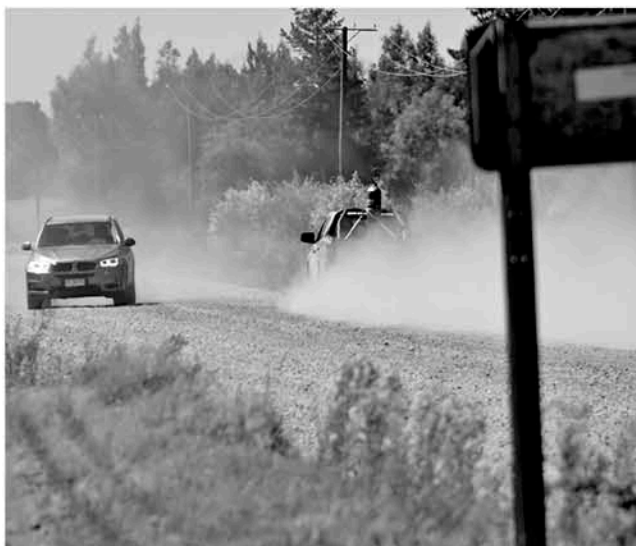
EL POLVO QUE LEVANTA el paso de vehículos y camiones es tal, que dificulta la visibilidad, por lo que ya se han registrado accidentes de tránsito en la vía.