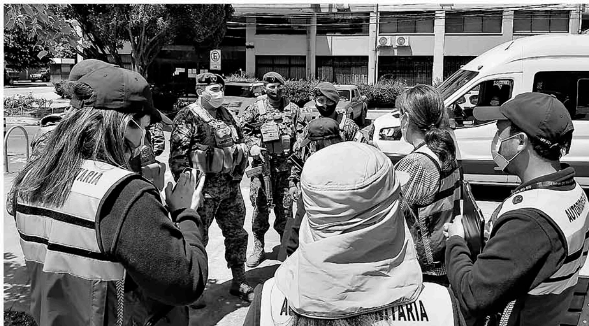
EN EL ÚLTIMO BALANCE, la Seremi de Salud señaló que se iniciaron tres sumarios sanitarios este fin de semana, todos contra campings.