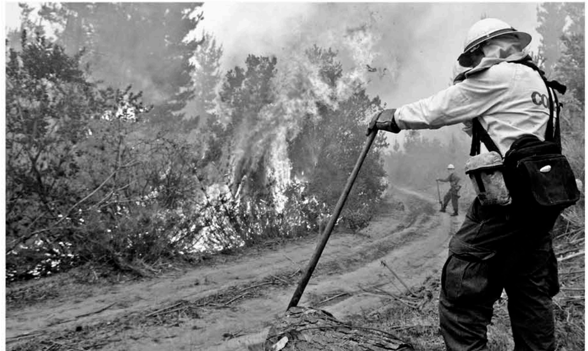
RESPECTO A LA OCURRENCIA de incendios por provincia, Conaf informó que Arauco registra 144 incendios, seguida por Concepción con 77, y Biobío con 60 incendios forestales.