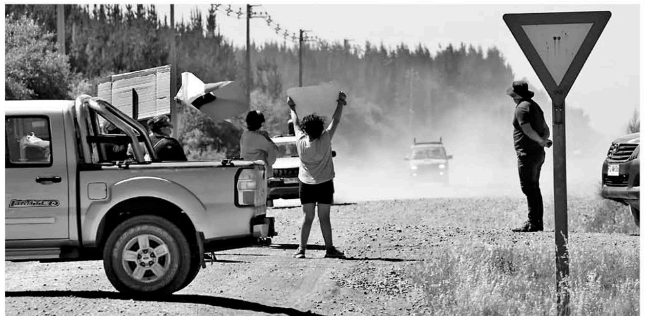
CORTES DE TRÁNSITO en al menos tres sectores desarrollaron los vecinos desde La Mona al Álamo Huacho.

Para la afectada y su esposo, la aplicación de matapolvo podría mitigar los efectos de la contami-