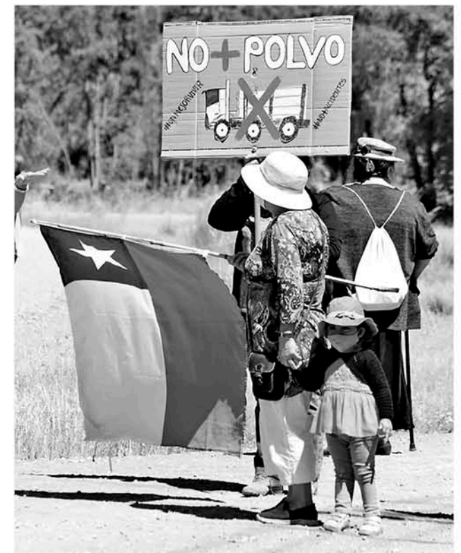
LOS NIÑOS Y ADULTOS MAYORES son los más afectados con la contaminación, ya que aseguran, les impide respirar de forma correcta.

ción a sus demandas dentro de los meses de noviembre a diciembre, conforme al programa establecido por la empresa global que está aplicando el producto.