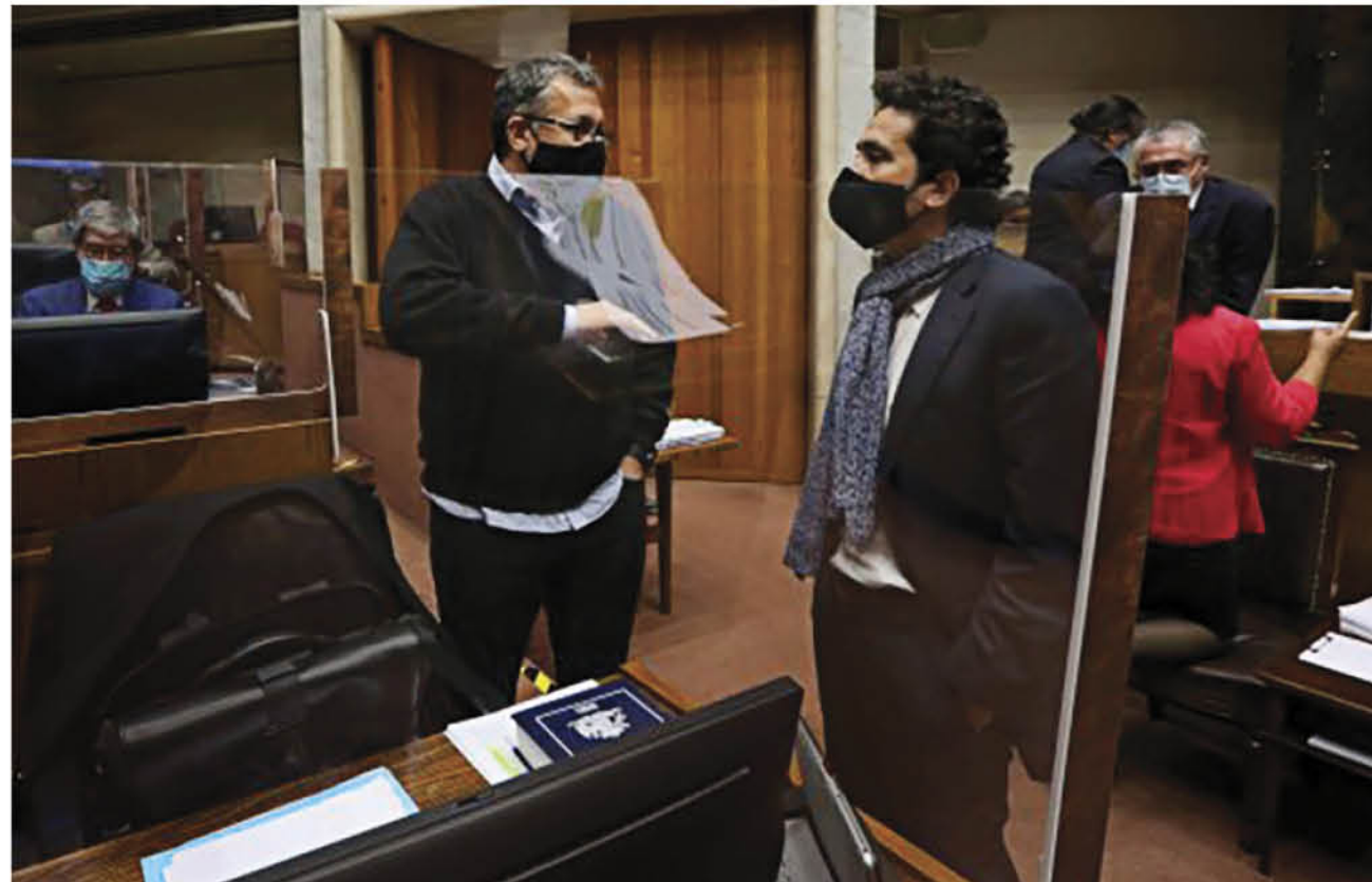
EL MINISTRO DE HACIENDA, Ignacio Briones ha defendido el presupuesto de La Moneda, que ya regresó a la Cámara de Diputados.

Lo anterior se vuelve vital si se considera que por primera vez en la historia de nuestro país, los chilenos podremos elegir nuestros/as gobernadores/as regionales, los que tendrán