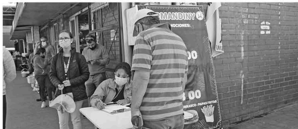
UN NÚMERO importante de personas de sectores rurales de Los Ángeles y sus alrededores se testeó en la clínica móvil del Servicio de Salud Biobío habilitada para tales efectos.

das a los pacientes, quienes ya se encuentran en sus cuarentenas preventivas.