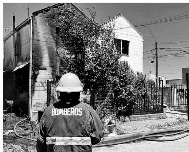
INCENDIO OCURRIDO en la villa Los Profesores en las intersecciones de calles Aurelio Valenzuela con Sergio Hernández.

El segundo consumió completamente la cocina de una vivienda en el sector de Chacayal Norte, distante a 20 kilómetros del radio urbano de la ciudad.