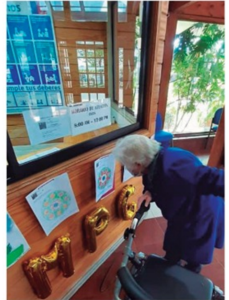
El grupo etario con mayor ingreso corresponde a pacientes mayores de 60 años.