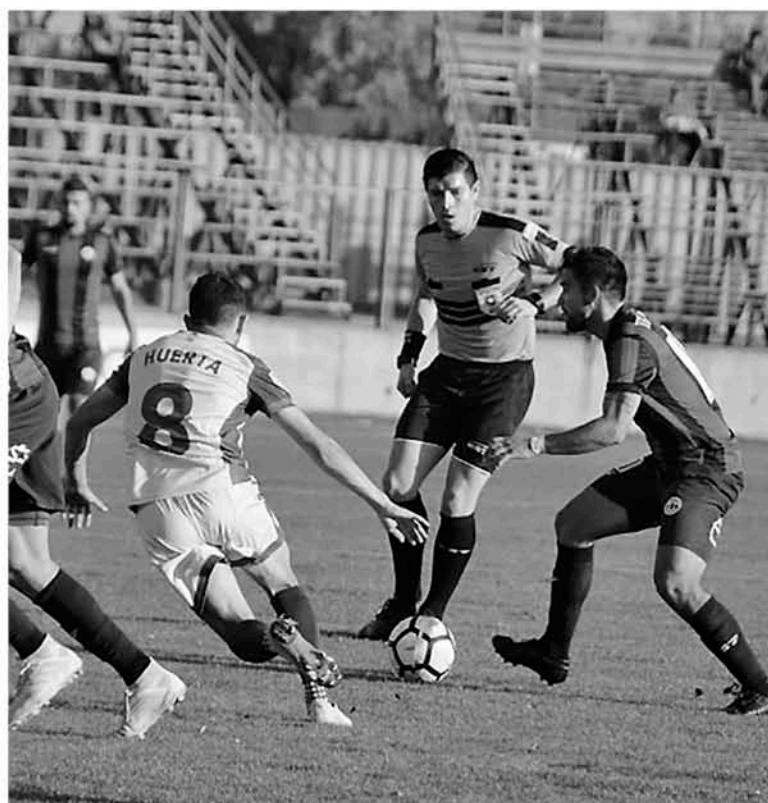
SOLO DOS PARTIDOS han jugado entre sí, Iberia y Colina, los dos con triunfo para el equipo de los "eléctricos".

Corrida la undécima fecha, casi la totalidad de los partidos ya se han jugado, es el caso de Recoleta ante Fernández Vial que terminó igualado a dos tantos. El empate a uno entre el puntero Lautaro de Buin y General Velásquez; triunfo de Independiente de Cauquenes 2 a 1 ante Deportes Vallenar y la partida sin goles entre D. Concepción y San Antonio Unido.