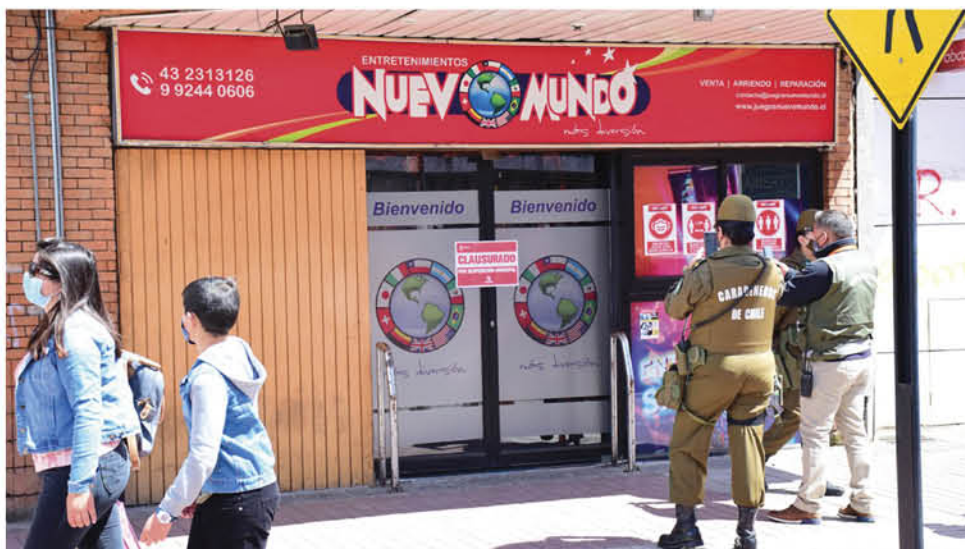
SEGÚN EL MUNICIPIO ANGELINO, los sellos de clausura fueron sacados por los propietarios para volver a funcionar.

Por lo mismo, argumentó que dada la naturaleza del caso, sólo el alcalde puede y debe querrellarse en representación del municipio. "Esta situación se debe investigar y verificar si hay denuncias en fiscalía a las cuales se haga parte la Municipalidad como querellante, dando uso el Alcalde a su facultad del artículo 63 literal p) de la mentada ley, en miras de averiguar los eventuales procesos penales en curso", concluyó.