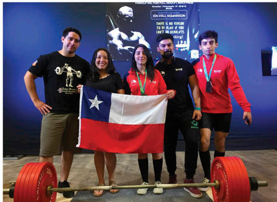
LOS ATLETAS ANGELINOS esperan lograr situarse en lo alto de las diversas competencias nacionales que se desarrollarán el 2021.

gran problema logístico ya que el espacio no permite el distanciamiento social impuesto por las autoridades sanitarias para la realización de una práctica deportiva segura. Y tampoco la instalación de nuevas pesas o maquinarias de apoyo para el levantamiento.