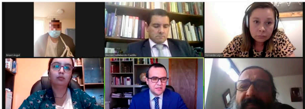
EL TRIBUNAL DETERMINÓ dar la identidad del imputado, pero no su imagen, pese a ello hasta no existir sentencia, no hay culpabilidad del comunero.

El detenido, identificado con las iniciales Q.A.F.Q habría participado de la marcha conmemorativa de la muerte de Camilo Catrillanca, para luego disparar contra la policía uniformada, en un enfrentamiento que fue grabado por cámaras de seguridad.