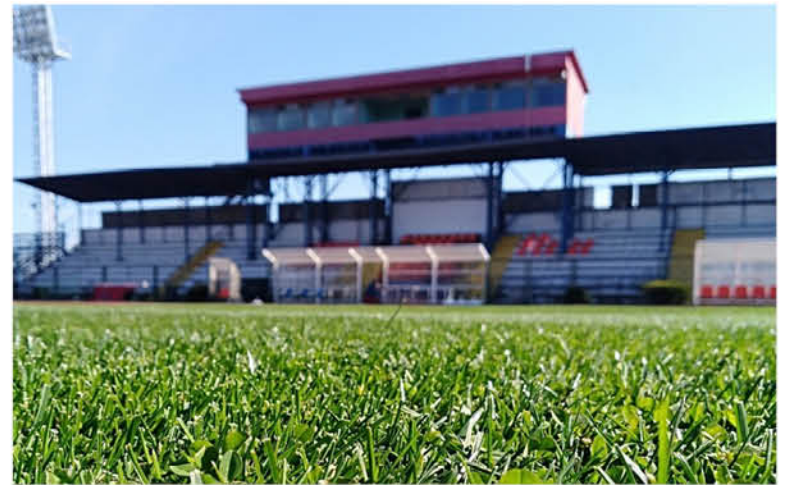
LA ÚLTIMA VEZ QUE IBERIA JUGÓ EN LOS ÁNGELES, fue el 1 de septiembre del 2019 ante Fernández Vial ganando por 3 a 2.

Dentro de los trabajos a realizar es necesario habilitar un nuevo camarín para el equipo local, otro para la visita y uno para los árbitros, además de