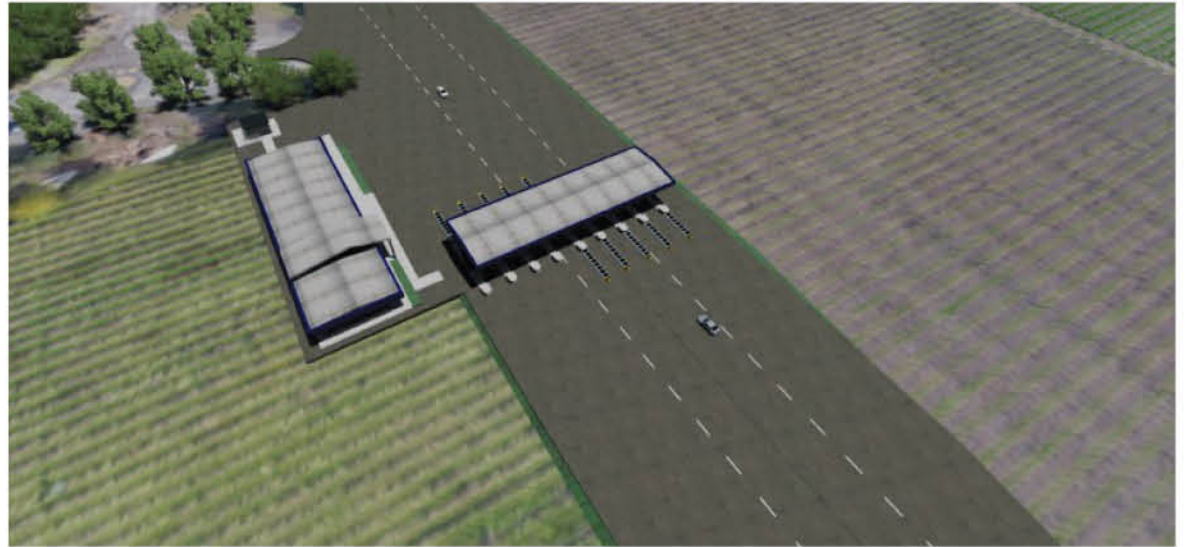
EN COIGÜE, EN EL LADO NORTE del puente sobre el río Biobío, se instalará uno de los dos peajes troncales.

En la misma condición se encuentran los trabajadores que frecuentan la ruta para cumplir sus labores en Nacimiento, Negrete, Renaico o Angol y que ahora deberán pagar un peaje por usar ese tramo de la vía.