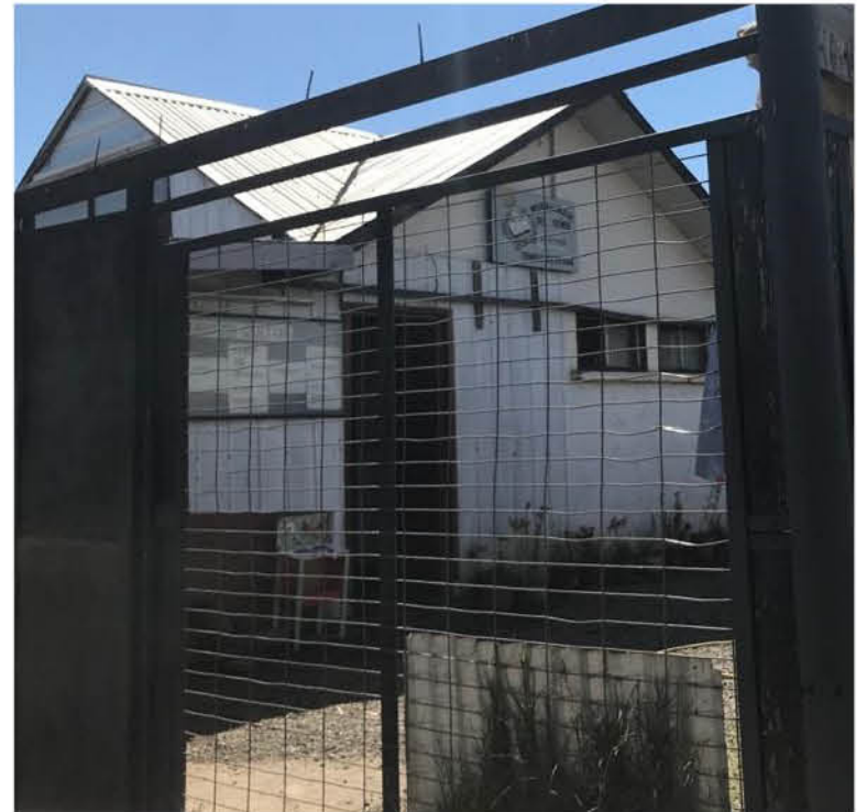
LA SEDE EN CUESTIÓN está ubicada en la villa Padre Alberto Hurtado, en la intersección de los pasajes Tapihués y Ana Cruchaga.

Acuña por lo mismo informó que "junto al alcalde de Los Ángeles firmaron un acuerdo el ocho de octubre, donde yo tengo 60 días hábiles para dejar el lugar y lo único que yo estoy esperando es que la persona que nos cuida, tiene que recuperar