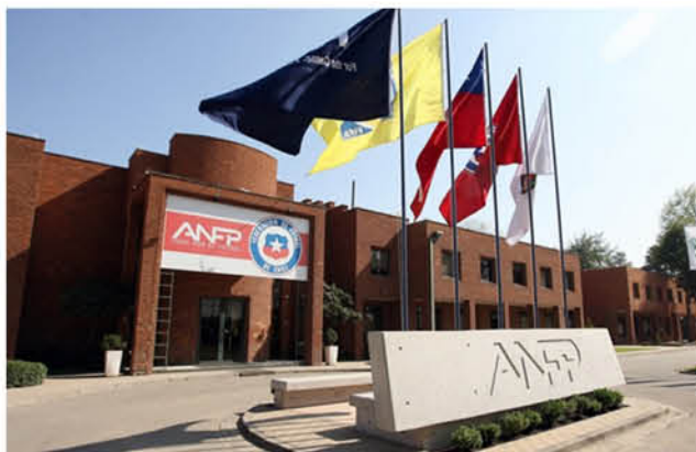
MEDIDA ADOPTADA por el área de competiciones de la ANFP dejaba en duda el partido para hoy.