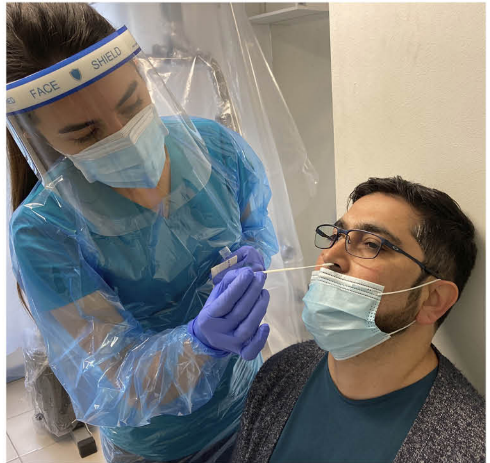
QUIENES DESEEN PARTICIPAR DE DICHS OPERATIVOS solo deben portar su cédula de identidad para el registro correspondiente, ya que la toma de examen es totalmente gratuita.

Considerando la importancia del aislamiento temprano de quienes padecen coronavirus para mantener a raya los contagios, desde la Seremi de Salud llamaron a consultar inmediatamente a quienes padecen uno o más síntomas asociados a la enfermedad, ya que se ha constatado que los pacientes tardan días en acudir a los centros asistenciales para testarse.