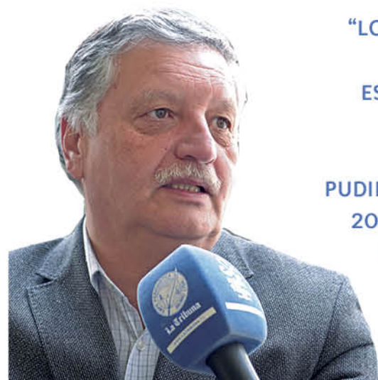
Esteban Krause, Alcalde.

Por último, los gremios de educación en Los Ángeles concordaron en que esperan que este plan sea corregido, indicando que siempre estarán disponibles para un diálogo constructivo y fructífero, ya que esto es por la educación de los jóvenes de la comuna.