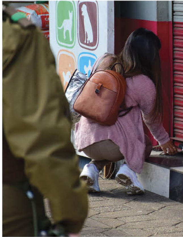
A FINES DE OCTUBRE, los 27 casinos de juegos populares de Los Ángeles fueron cerrados por no tener patente municipal.

A partir de dictámenes de la Contraloría General de la República y del procedimiento establecido en la circular Nro. 83 de la Superintendencia de Casinos de Juegos, se estableció que si las patentes comerciales quieren ser renovadas para el siguiente periodo, los contribuyentes deben acreditar el cumplimiento de los requisitos establecidos en la ley. ¿Y cuáles son esos requisitos? Que las máquinas en estos locales sean de destreza o habilidad y que no sean de azar, condición que sí cumplen los