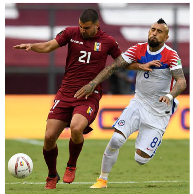
UNA IMPENSADA DERROTA de la Selección chilena en Caracas.

en Chile. Ni la entrada del angelino Claudio Baeza ni la de Palacios, lograron cambiarle la cara a una desteñida Selección chilena. Salomón Rondón marcó el definitivo 2 a 1 para Venezuela.